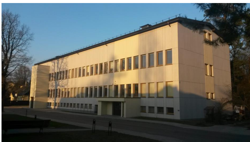
2015 m. balandžio 10 d. VšĮ Vilniaus Jeruzalės darbo rinkos mokymo centras

Mindaugas Černius, VšĮ Vilniaus Jeruzalės darbo rinkos mokymo centro direktorius Tel. (8 5) 26974 55. info@mokymas.eu . www.mokymas.eu